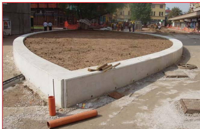
Obrázky z opravy sídliště Karla IV.