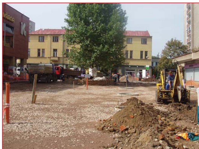
Obrázky z opravy sídliště Karla IV.