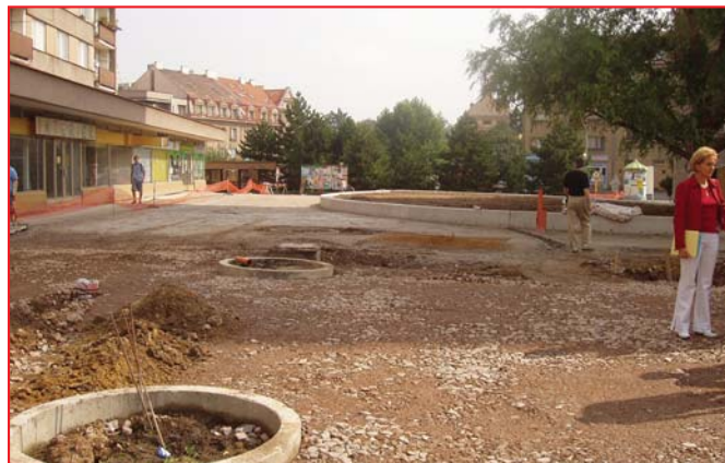
Obrázky z opravy sídliště Karla IV.